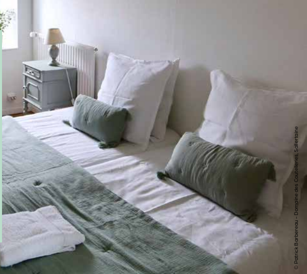
© Patrick Barbereau - Domaine des Cartonniers, Saletagne

C'est une ressource perçue par les collectivités locales qui permet de financer les dépenses liées à la fréquentation touristique ou à la protection des espaces naturels. Elle est régie par le code général des collectivités territoriales. Elle concerne tous les hébergements loués pour de courtes durées, professionnels ou non.